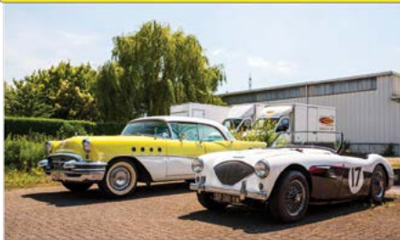
Rit van de vriendschap