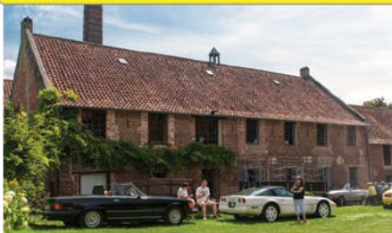
Ritje van de Voorzitter